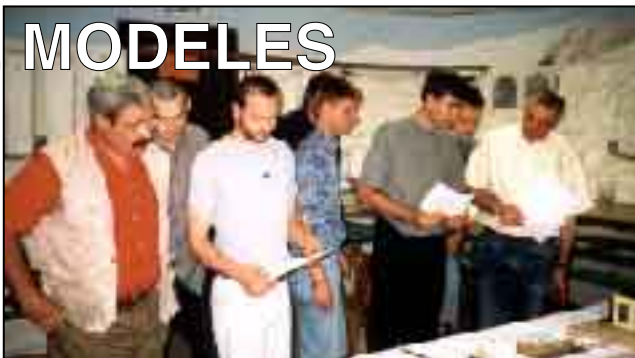
Le jury interclubs en pleine action