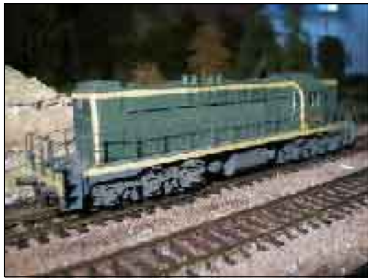
Modèle HO CARPENA & GOUPILLE (réalisation N. LE PLEY)

Au départ, je souhaitais me faire la main sur un petit bricolage en carte plastique, mais c'était compter sans l'amicale complicité très documentée de mes petits camarades. Finalement, ce serait tout laiton, c'est-à-dire une feuille de 50x50cm en 3/10° et une feuille idem en 1/10°, le tout 68,00 F. Aussi peu d'investissement financier, ça touche au snobisme.